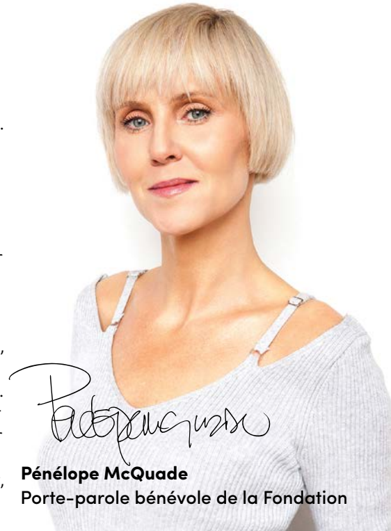
Pénélope McQuade Porte-parole bénévole de la Fondation

congrégation des Sœurs de la Providence. Elles sont à l'origine de nombreuses œuvres de charité, dont la création de la Fondation de l'Hôpital du Sacré-Cœur de Montréal, en 1976. C'est à elle que nous devons le premier Hôpital des incurables et sanatorium, qui allait devenir un jour l'Hôpital du Sacré-Cœur. Fière de ses fondatrices, la Fondation a choisi en 2009 de donner le nom d'Émilie à la statuette remise aux lauréats du Gala des Émilie, en hommage à celle qui a mis sur pied la congrégation, Émilie Tavernier-Gamelin. Des médecins et des personnes qui sont engagés dans le but ultime d'améliorer les soins de santé sont honorés chaque année lors de ce grand rassemblement, que j'animerai encore avec plaisir. Que de beaux liens nous unissent !